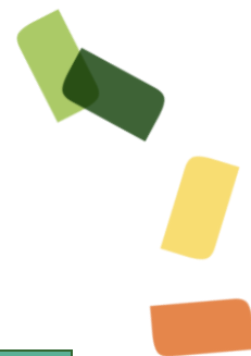
Table 9: Data4FoodCluster mastodon account